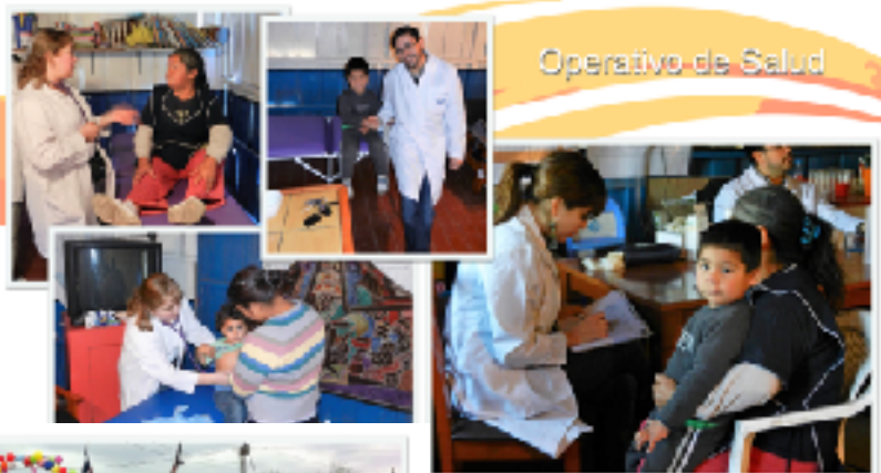
Operativo de Salud

Con Desafío también hicimos un operativo de Salud