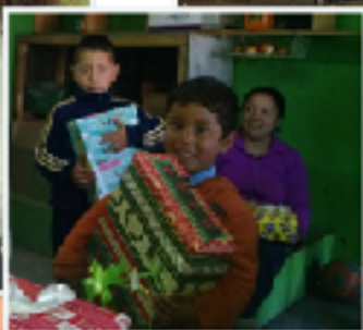
Día del Niño

Y celebramos nuestro primer "Día del Niño"