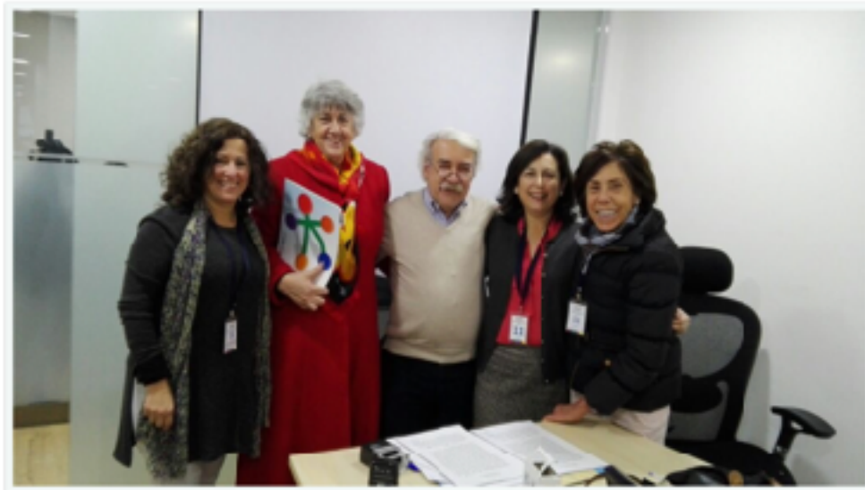
Constitución Legal - Municipalidad de Las Condes

Y así fue como el 5 de Julio del 2017 nos constituimos formalmente.